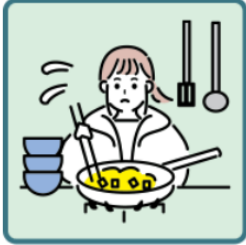
障がいや病気のある家族に代わり、買い物・料理・掃除・洗濯などの家事をしている

「ヤングケアラー」とは、法律上の定義はありませんが、一般に、家族にケアを要する人がいる場合に本来大人が担うと想定されている家事や家族の世話などを日常的に行っている子どもとされています。年齢や成長の度合いに見合わない重い責任や負担を負うことで、本人の育ちや教育に影響がある、といった課題が指摘されています。