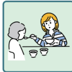
障がいや病気のある家族の身の回りの世話をしている