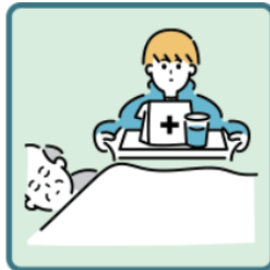
がん・難病・精神疾患など慢性的な病気の家族の看病をしている