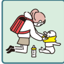
家族に代わり、幼いきょうだいの世話をしている