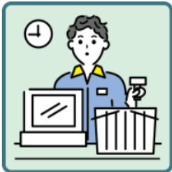
家計を支えるために労働をして、障がいや病気のある家族を助けている