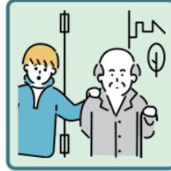
目を離せない家族の見守りや声かけなどの気づかいをしている