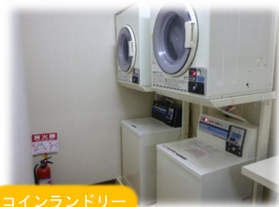
コインランドリー

居室はエアコン、トイレ、ミニキッチン、クローゼット、小型冷蔵庫、床頭台などを配備した快適仕様。緊急呼び出しコール配備の「安心仕様」です。